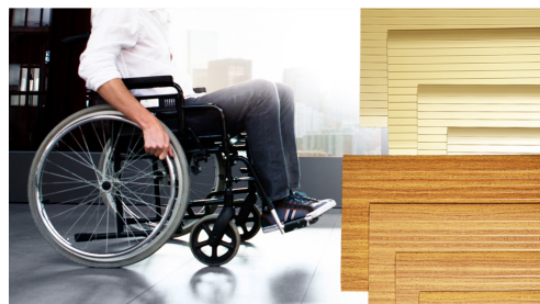
Ramper, Trösklar & Kilar