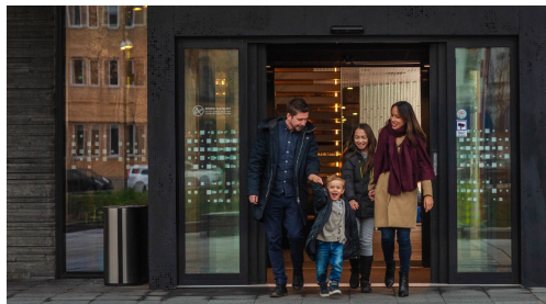
Dörrautomatik & Passersystem

Bäste kund, nedan ser ni vilka produktkategorier Dooman har att erbjuda.