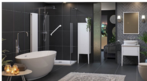
Stödhandtag & Ledstänger