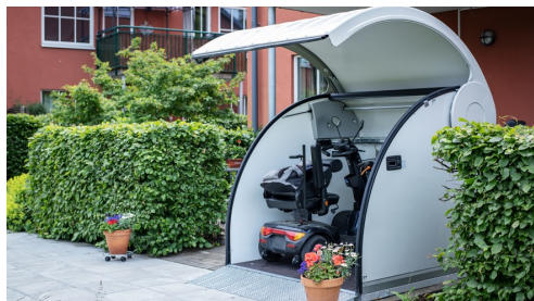
Minigarage med tillbehör