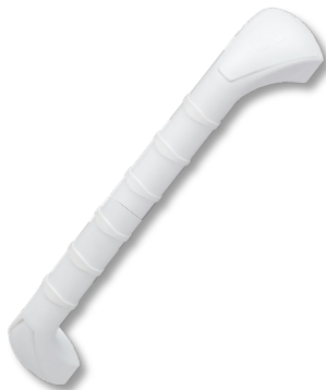
Stödhandtag PA40 Längd 40cm, plast Art.nr. 6497