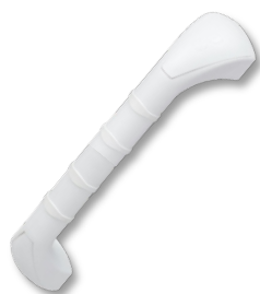
Stödhandtag PA30 Längd 30cm, plast Art.nr. 6496