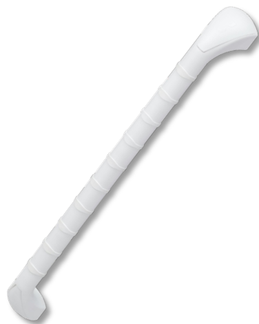
Stödhandtag PA60 Längd 60cm, plast Art.nr. 6498