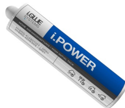
Power Big pack 310ml Tub för fogspruta Art.nr. 6511

Dooman Teknik bidrar och jobbar enligt FN's följande världsmål: